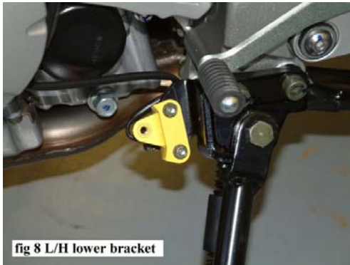
fig 8 L/H lower bracket