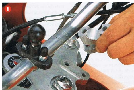
Bild 1: Um freien Zugang zu der Gabel-Verschlusschraube zu erhalten, empfiehlt sich bei Rohrlenkern die Demontage. Vorderrad und Gabel müssen vollständig entlastet werden. Bild 2: Ein Wagenheber oder Holzklötze leisten hier gute Dienste.

Das alte Öl wird mittels einer handelsüblichen Vakuumpumpe, die ursprünglich zur Brems-Entlüftung gedacht ist, entfernt. Neben der Pumpe braucht es dann nur noch zwei Wagenheber, einen Zollstock, Knarrenkasten und einen Drehmomentschlüssel. Die richtigen Anzugsmomente der entsprechenden Schrauben finden sich üblicherweise im Fahrer-Handbuch, alternativ gibt die Vertragswerkstatt darüber Auskunft.