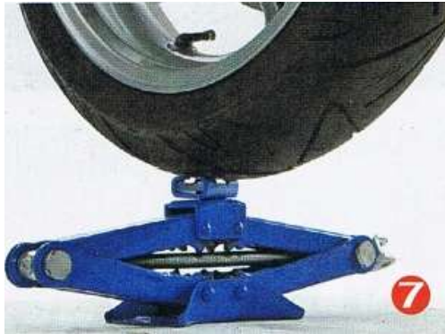
Bild 7: Ein zweiter Wagenheber eignet sich prima, um das Vorderrad nach oben zu liften.