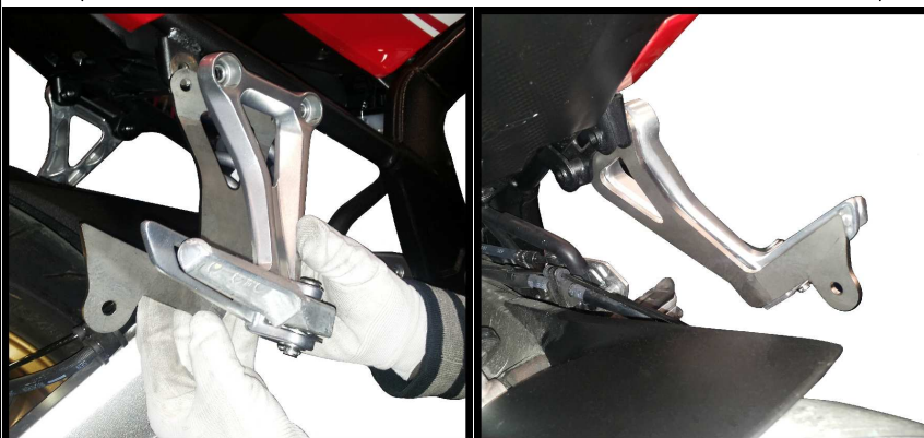
Fissaggio staffa 50.SS.873.1 Fitting bracket 50.SS.873.1