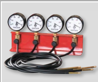
Synchrontester mit 4 Uhren