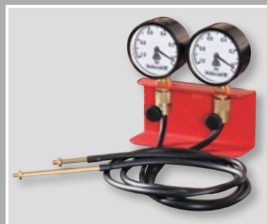
Synchrontester mit 2 Uhren