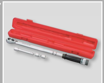
Drehmomentschlüssel (40-210 Nm)