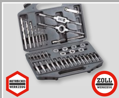
Handgewindebohrer- und Gewindeschneide-Sets